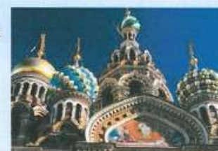
St. Petersburg, Russland

Höhepunkte: Höhepunkte der Ostsee – erleben Sie den einzigartigen Kulturraum des Baltischen Meeres, Jazz und Soul mit Sidney's Jazz Compagnie, Themenreise Golf und Garten. Im Sommer begeistert das unvergängliche Licht der