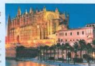
Palma de Mallorca, Spanien

Höhepunkte: Genießen Sie den Spätsommer im westlichen Mittelmeer zwischen den Balearen und der „Ewigen Stadt“, Große Operetten an Bord des Traumschiffs, Meisterwerke des großen Komponisten Franz Lehár, u.a. „Der Graf von Luxemburg“ erdigen im prachtvollen KAISERSAAL., Wellness-Programm, Themenreisen Garten und Hochzeit.